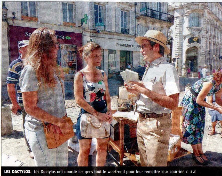
LES DACTYLOS. Les Dactylos ont abordé les gens tout le week-end pour leur remettre leur courrier.

J'assiste à un spectacle humoristique, décalé, voire un peu loufoque de Monsieur et Madame, place du Maréchal-Leclerc. Je suis la déambulation de restitution des enfants des ateliers Lézards des arts, en musique et en costumes. J'observe la Chorale Public interpréter quelques