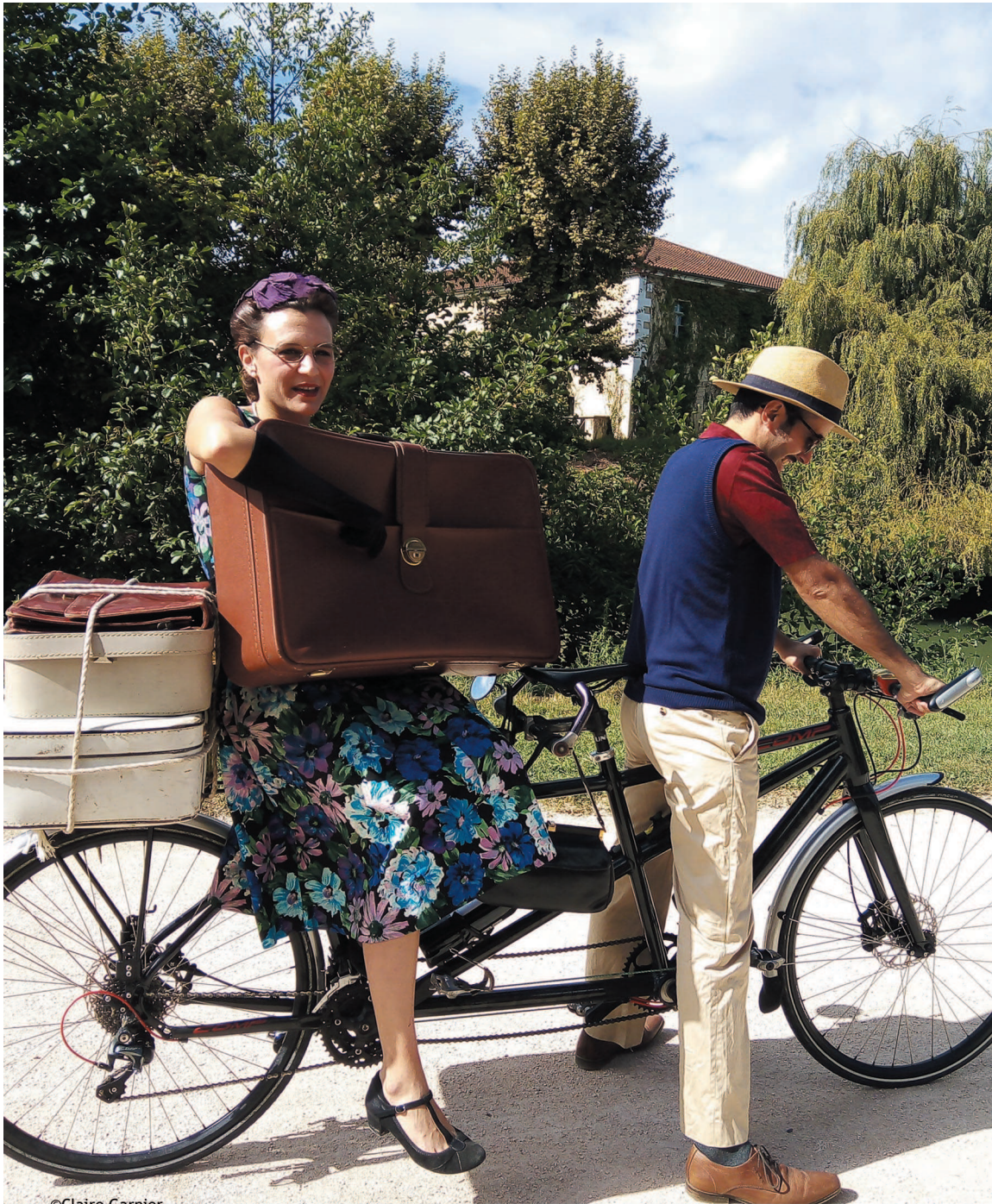
Promenade Henri Desbonds Auch - M 24 sept 19