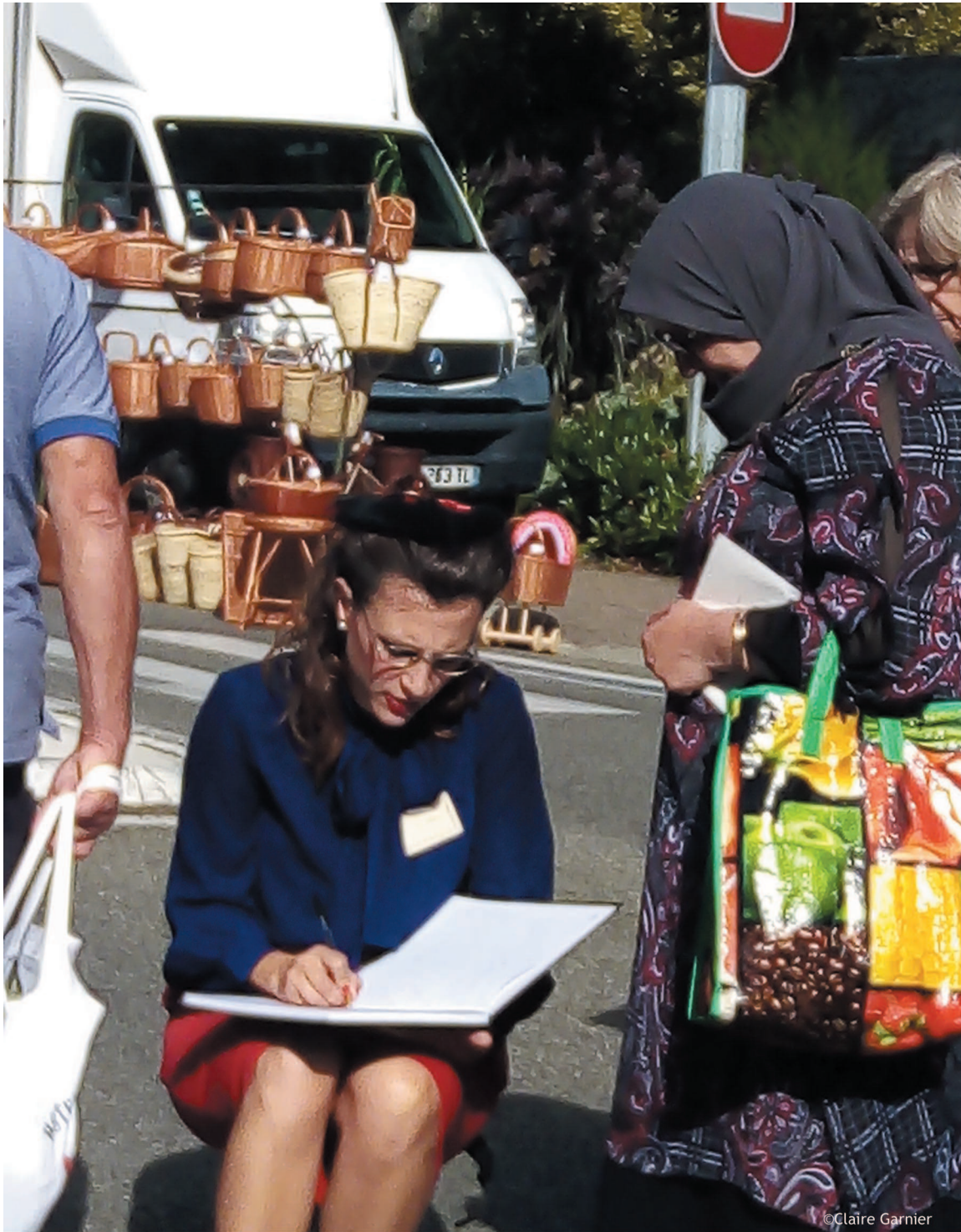
Marché Auch - J 26 sept 19