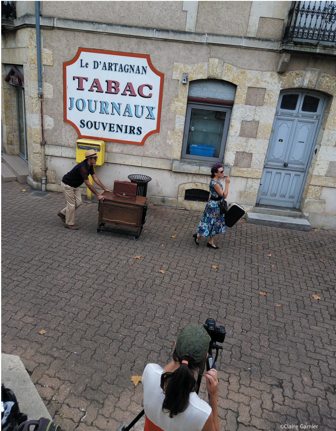
Quai Lissagaray Auch - M 24 sept 19