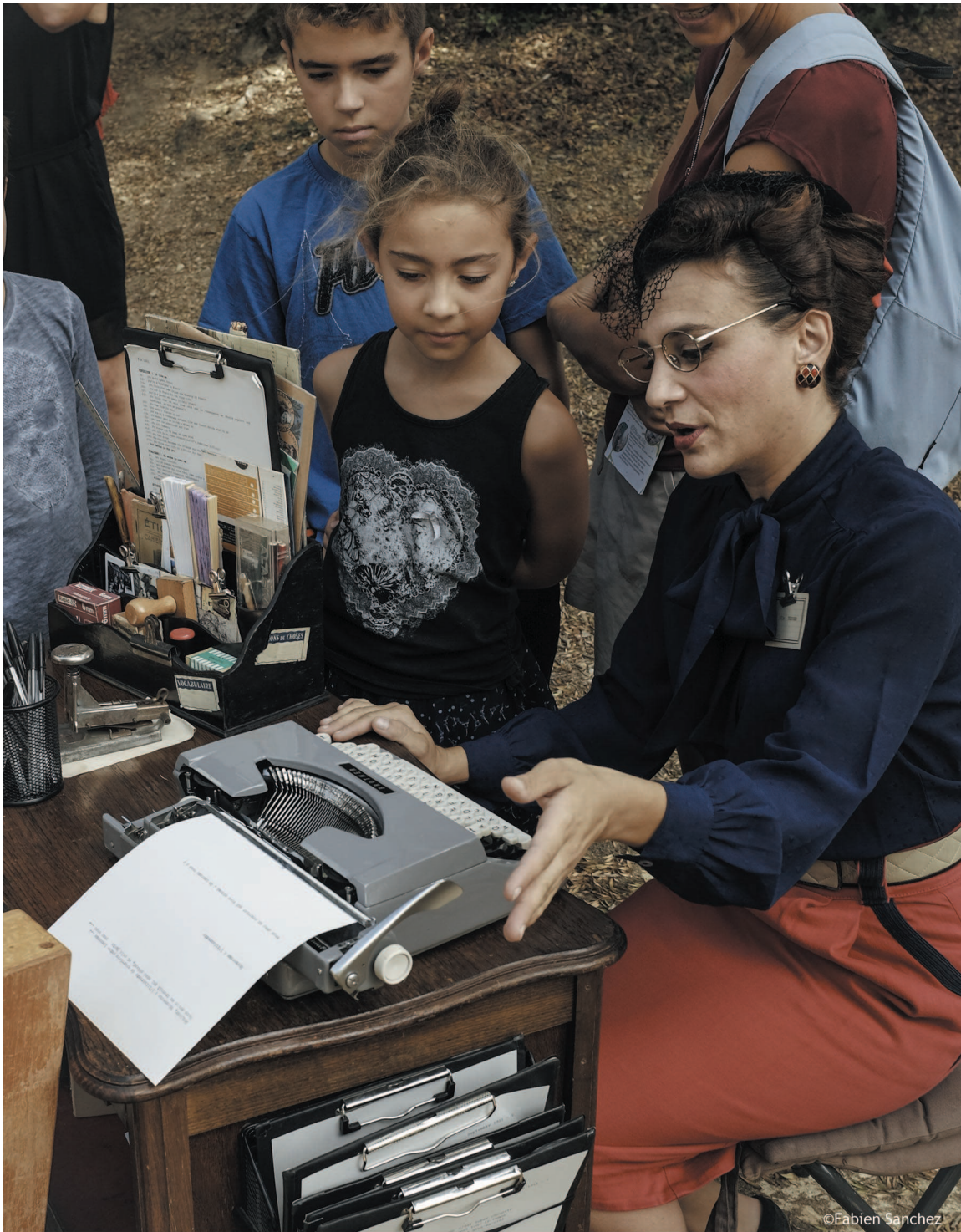
Festival N'Amasse pas Mousse Castéra-Verduzan - S 21 sept 19