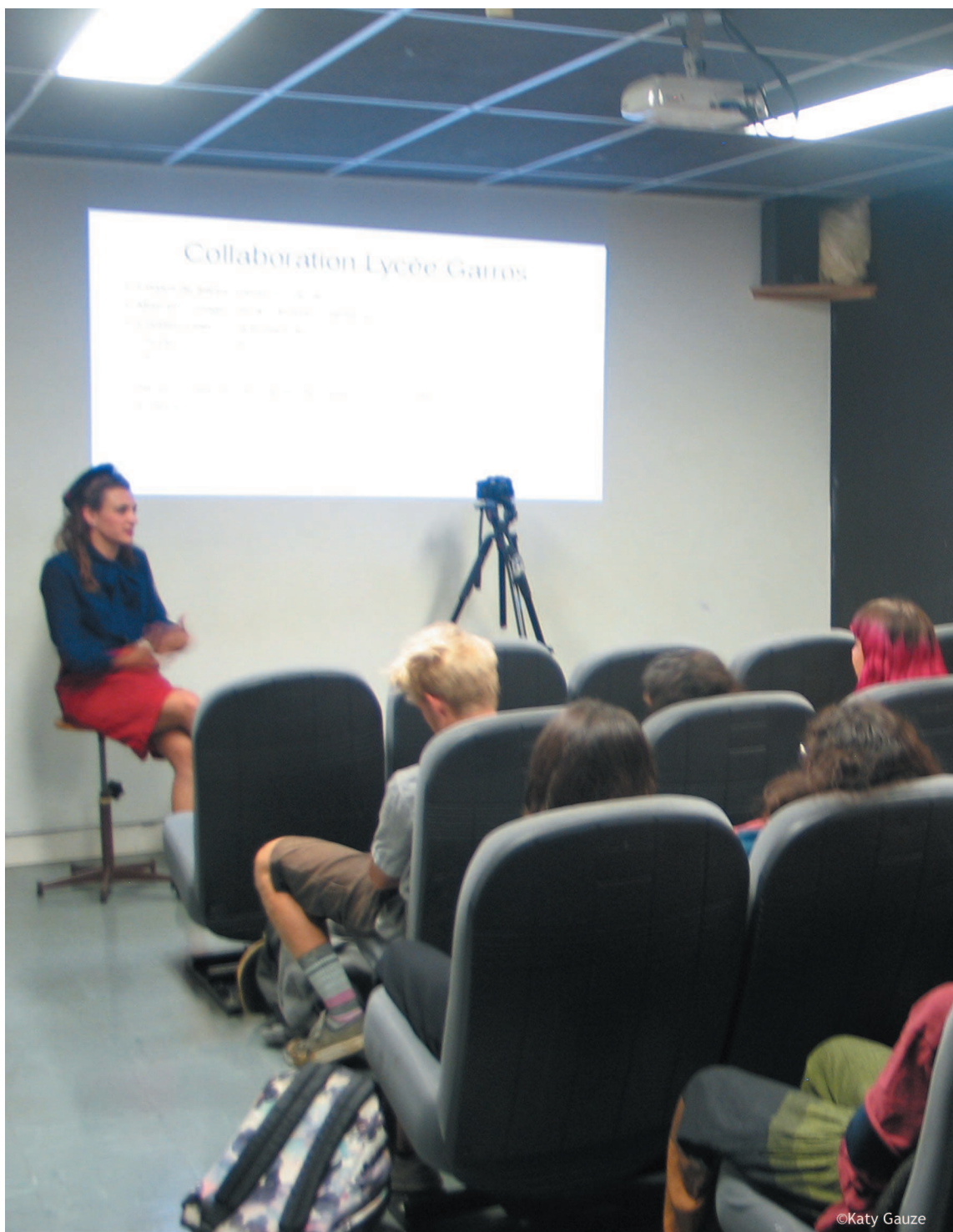
Lycée Le Garros Auch- M 24 sept 19